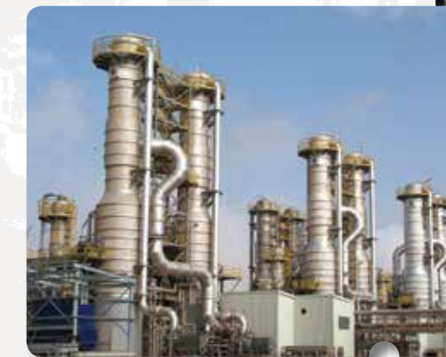
世界上最大产水能力的蒸发系统