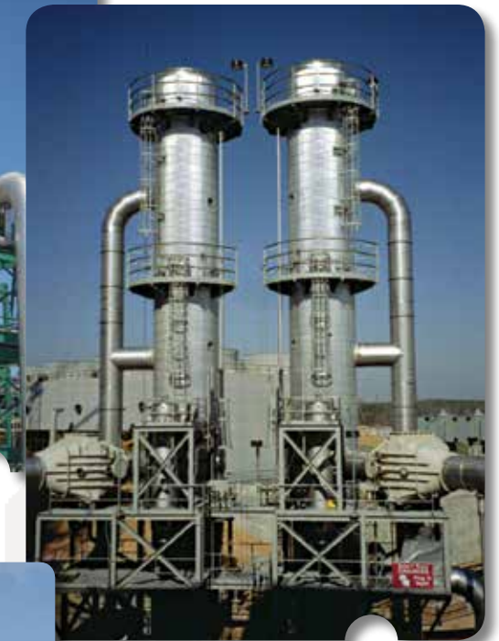
冷却塔排污水，浓盐水浓缩器