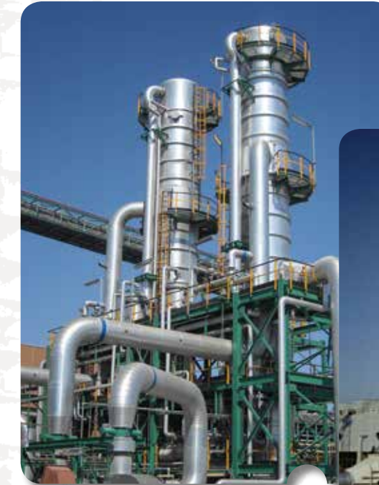
烟气脱硫废水液体零排放系统